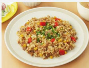
黄金の味で彩りペッパーチャーハン