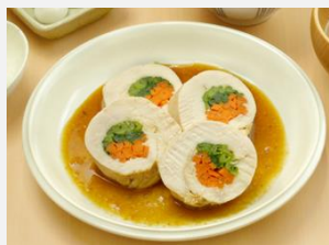
黄金の味で色鶏ロール