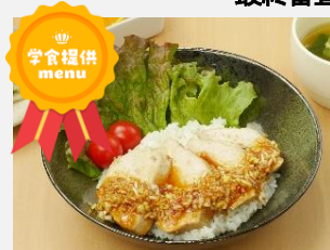
黄金の味で至極のカオマンガイ