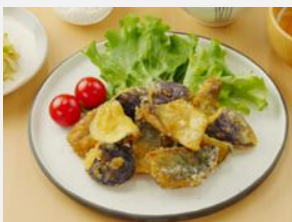
黄金の味でサバとナスのからあげ