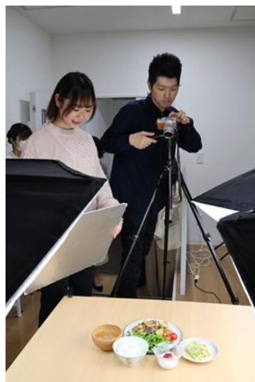
レシピ撮影の様子