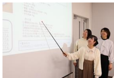
1次審査 プレゼンの様子

最終審査へ進んだ4レシピは、特設サイト「エバラ×シーラボ☆『黄金の味』を使ったコラボレシピ」にて紹介するため、当社でレシピ撮影を行いました。「シーラボ☆」のメンバーにも参加いただき、おいしく見せるコツやレフ板の使い方などをレクチャーしながら撮影を進めました。